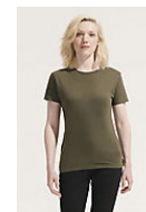
SOL'S REGENT WOMEN 01825