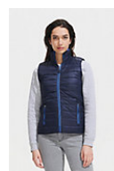
SOL'S WAVE WOMEN 01437