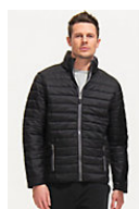
SOL'S RIDE MEN 01193