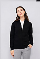
SOL'S GORDON WOMEN 00550